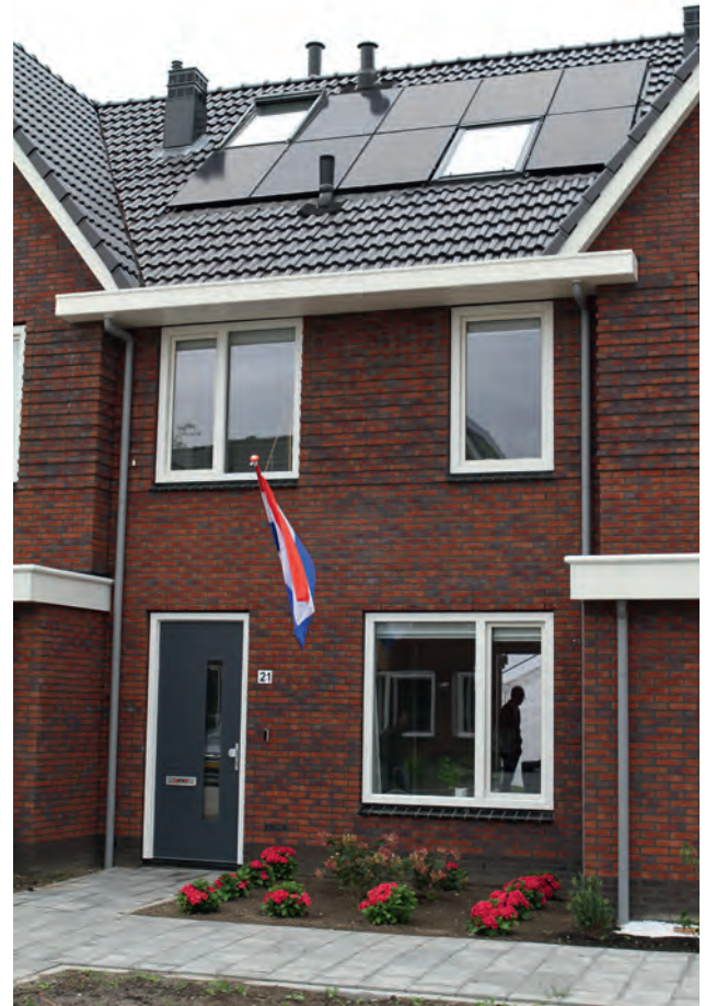
De meet- en demonstratiewoning in Heerhugowaard blijft de komende tien jaar een testlab.

De NeroZero-woning is voorzien van een bodemwarmtepomp en daarmee gasloos, goed geïsoleerd en zit wat luchtdichtheid betreft bijna op passiefhuisniveau ( q_{v,10} van 0,16). Meerkosten ten opzichte van een huidige nieuwbouwwoning met gas: 7.250 euro, exclusief btw en opslagen. Met circa tien extra PV-panelen à 3.000 euro (excl. btw en opslagen) is de woning NOM. 🏠