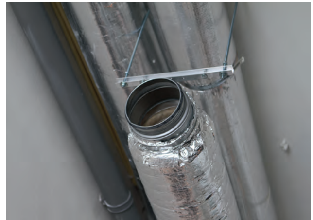
Inblaaskanaal op de zolder. Het trappgat fungeert als één groot inblaaskanaal.